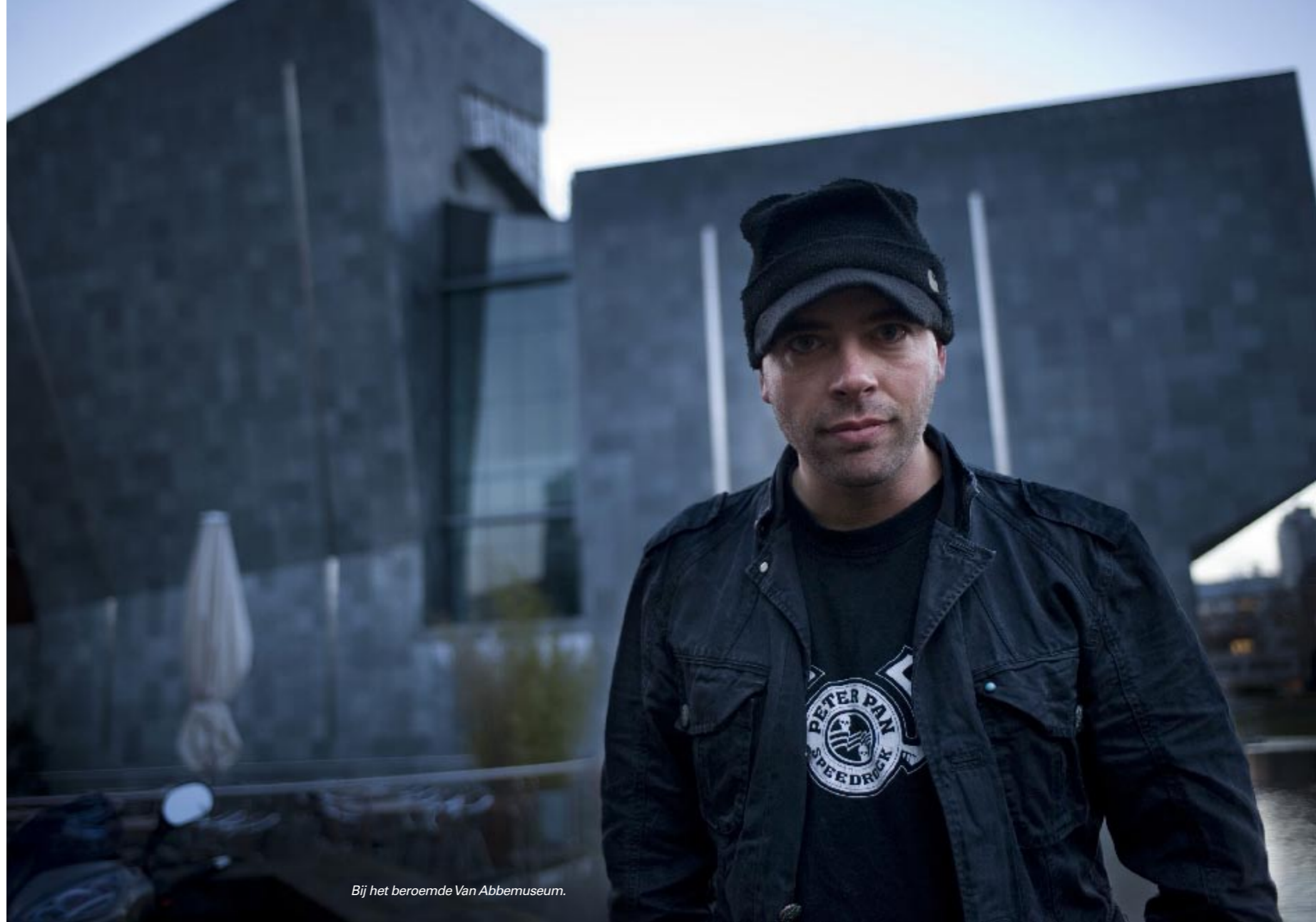
Bij het beroemde Van Abbemuseum.

Door Leon Verdonschot